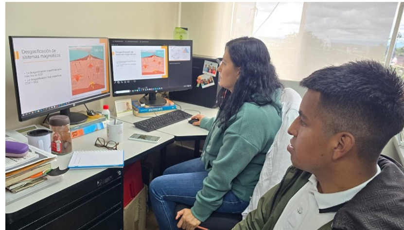
Imagen 2: Acompañamiento técnico al Programa de Gestores Sociales para la Paz - UNGRD-SGC